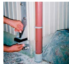
上部金具と下部金具の連結