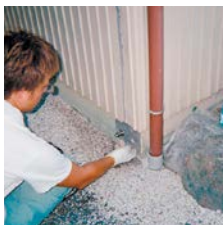
下穴の加工・基礎パネルの取付