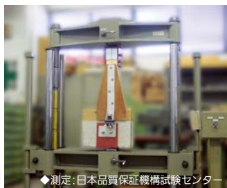
測定: 日本品質保証機構試験センター

この実験は、製品に直接引張強度をかけるという、実際の住宅が地震等で受ける応力より厳しい条件で、検体が破断するまでの引張耐力を測定。その結果、6.8tの引張耐力が計測されました。